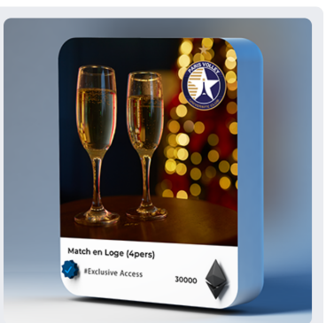
Loge pour 4 personnes 30000 PVT / 400.00 € Ultra rare