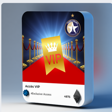
Place VIP 4875 PVT / 65.00 € Très rare