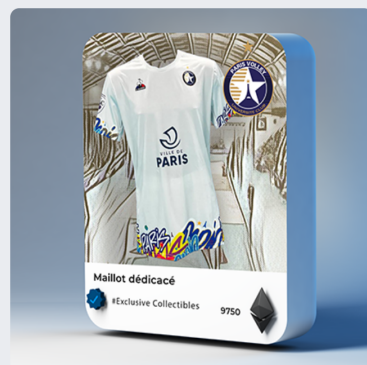
Maillot dédié 9750 PVT / 130.00 € Ultra rare