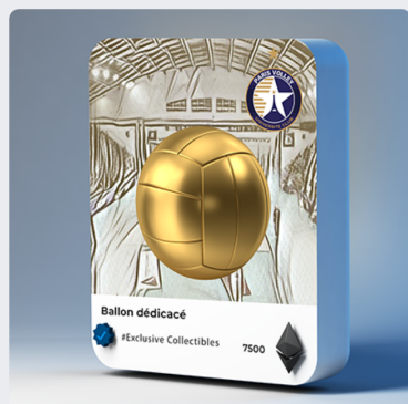
Ballon dédié 7500 PVT / 100.00 € Très rare