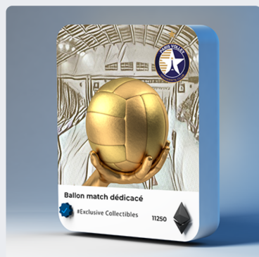
Ballon match dédié 11250 PVT / 150.00 € Ultra rare