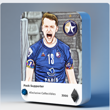
Pack Supporter 3000 PVT / 40.00 € Très rare